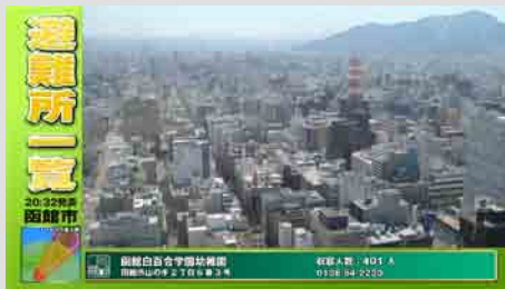
避難所情報 (L字スーパー)