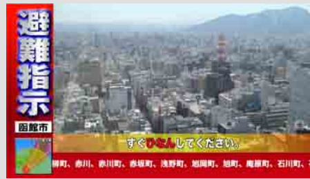
避難指示情報 (L字スーパー)